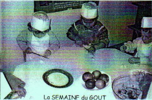
La SEMAINE du GOUT